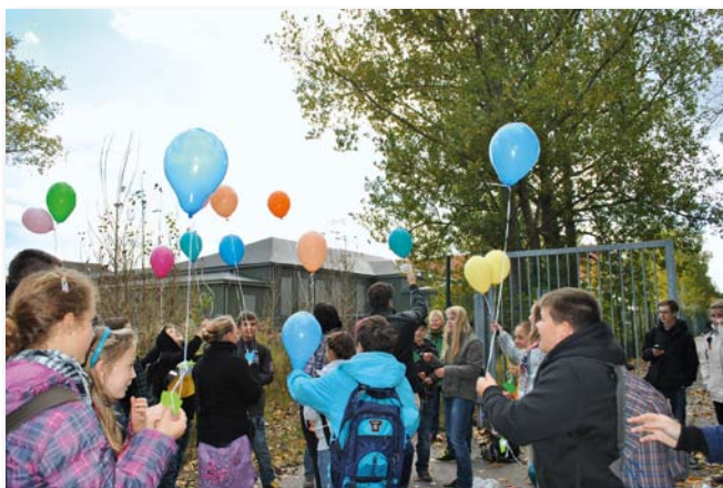
Wünsche und Hoffnungen der Kinder steigen symbolisch in den Himmel

Das Leitmaterial der Gedenkstätte Sachsenhausen empfiehlt für jüngere Schülerinnen und Schüler das Führen eines Journals. Im Verlauf des Projekts nutzen die Kinder es, um sich Notizen zu machen und Gedanken hineinzuschreiben. Sie können dieses frei gestalten. Es ist ihr Recht zu entscheiden, wem sie dieses Journal zeigen.