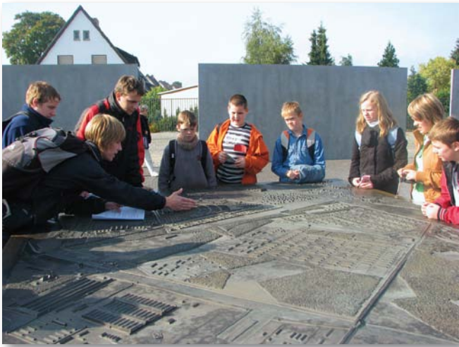
Arbeit am Modell der Gedenkstätte Sachsenhausen