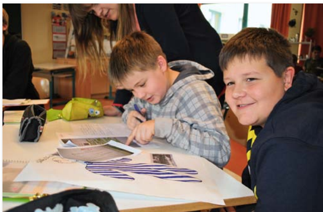
Peer-Learning im gesamten Projektverlauf

In der Klassenstufe 6 (und folgenden) wird im Fachunterricht Deutsch ein dem Thema nahe stehendes Kinderbuch bearbeitet (s. Literaturhinweise).