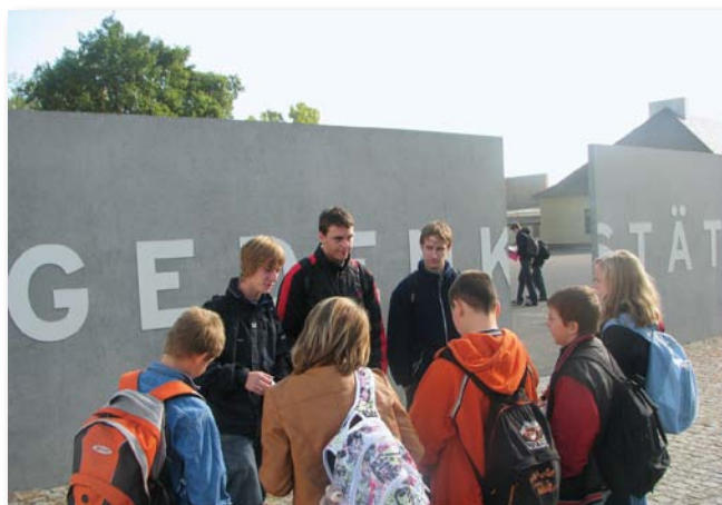
Eröffnung des Gedenkstättenbesuchs

Unterrichtsbeginn - Fahrt zur Gedenkstätte Zu Beginn der Fahrt werden alle Schülerinnen und Schüler über das Verhalten auf dem Gelände der Gedenkstätte und des Museums Sachsenhausen belehrt. Zudem nutzen wir die Fahrt bereits als Gruppenarbeitszeit.