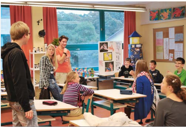
Peer-Learning-Team unter sich

Das Projekt ist geeignet für den Unterricht und/oder übergreifende Projektarbeit, in der Geschichte bzw. Geschichte und Politische Bildung Schwerpunktfach ist. Es ist wichtig, mit Kindern der Orientierungsstufe mit Opferbiografien zu arbeiten, die nicht in der Zeit des Nationalsozialismus enden. Berichte Überlebender sind hier angebracht.