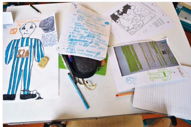
Arbeitsergebnisse der Schülerinnen und Schüler der 6. Klasse

Die Fachlehrerinnen und -lehrer der 6. und 12. Klassenstufen sind an einem zentralen Anlaufpunkt für Nachfragen oder Probleme ständig erreichbar. Die Liste mit den Arbeitsgruppen (M8), die auf mehrere Räume verteilt arbeiten, dient der Orientierung für Lehrerinnen und Lehrer. Sie beobachten zudem die Gruppen und notieren Sachverhalte, auf die im Nachhinein hinzuweisen ist (M9).